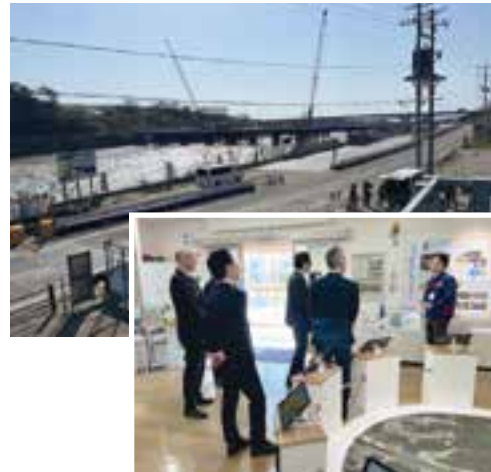
4月9日 【大河津分水視察】 燕市／長岡市