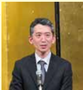
新潟県副知事 鈴木康之 様