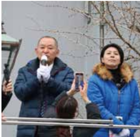
3月21日 【新潟駅前街宣活動】 新潟市中央区