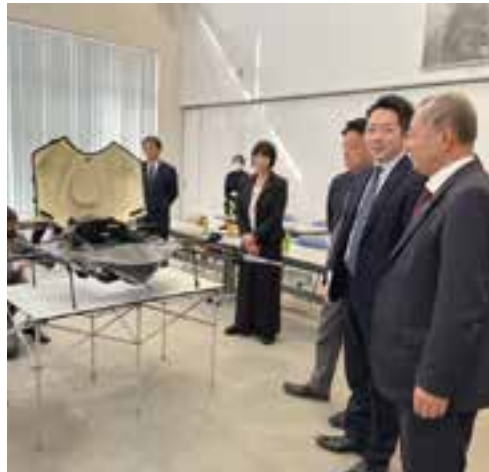
1月22日 【人口減少問題対策特別委員会視察】 阿賀町